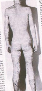
Psoriasispatient af ukendt alder