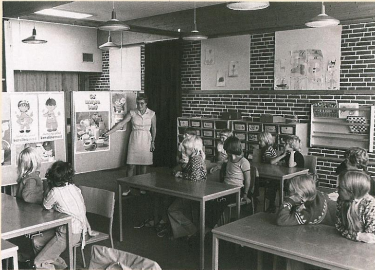
Skolesundhedsplejerske underviser elever i den rette sammensætning af morgenmaden, 1975.