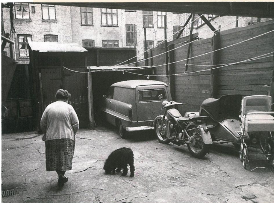
Københavns baggårdsmiljø, 1968.