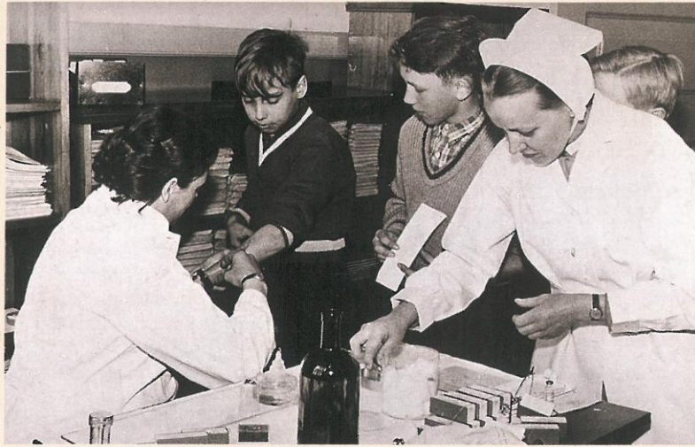
Skoleelever vaccineres mod tuberkulose af skolelæge og -sundhedsplejerske på Sankt Severin Skole i Haderslev, 1961.