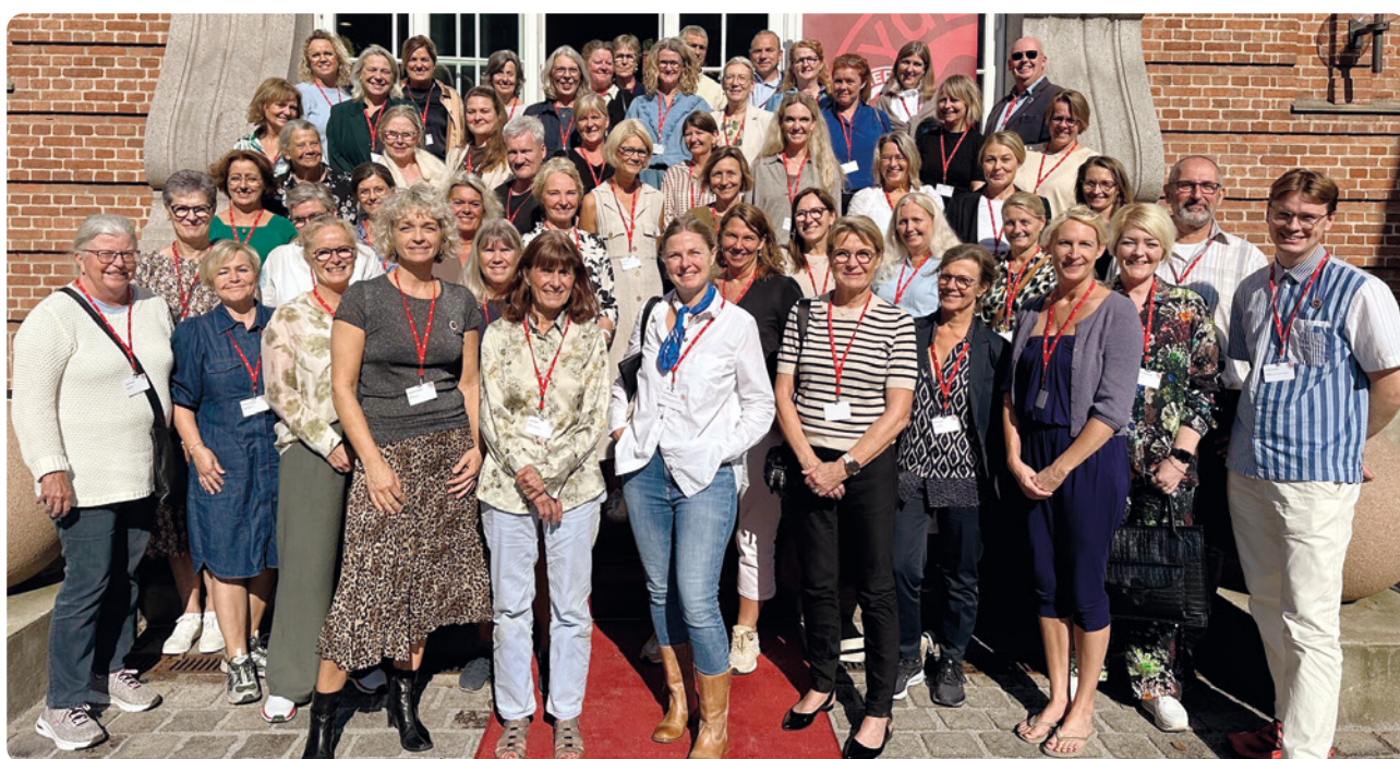
Fællesbillede fra sygeplejetopmødet i 2024

Derudover afholdt vi i 2024 Sygeplejetopmøde på Koldingfjord under temaet Tiden er til sygepleje . Her deltog 58 sygeplejersker – topledere fra hospitaler, kommuner og uddannelsesinstitutioner samt sygeplejefaglige professorer. Sygeplejetopmødet er et vigtigt rum for inspiration og er-