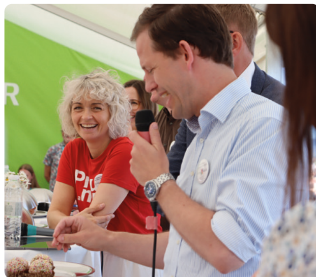
Folkemødet i 2025

I 2025 blev den faglige debat afviklet på Fagbevægelsens Plads for første gang. Debatten havde titlen Fra operationsstue til dagligstue og handlede om, hvordan vi kommer i mål med de politiske ambitioner i sundhedsreformen.