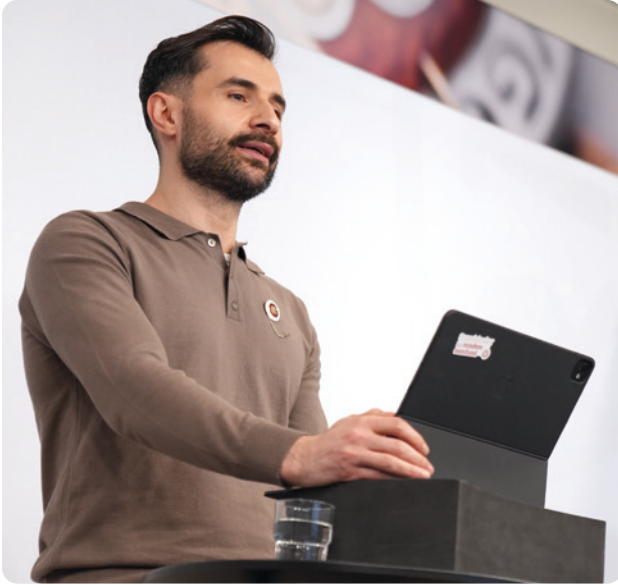
Virtuelt (F)TR-møde om sundhedsreformen afholdes