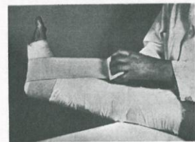
Fig. 11. Oringeplejerske, som ligbrude skal lægges stramt.