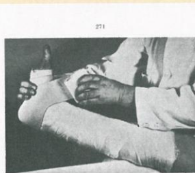
Fig. 10. efterkom, som skal lægges stramt.

Ude over Landet, i Hjemmesygeplejerskens Distrikter, sker det ofte ved et pludseligt Dødsfald eller ved begaet Selvmord, at en forsvundet, chokeret Familie staar raadløs, ude af Stand til at tage Initiativ til at ordne Liget. Mange Steder er det saa næsten blevet Kostume i sigt og Tilvænde at hente Sygeplejersken og lade hende gøre det. Det er svært for Sygeplejersken tilsvarende hertil at afvise en manden Henvendelse, naar paa den anden Side man det jo synes at være en mærkelig Opfattelse af en Sygeplejerskes Opgave at sende Hød eller hende, hver Gang et Lig skal ordnes, ja, ofte h. – Dog – af den stedlige Læge. Fra flere Hjemmesygeplejerskes efterhaanden medbragt Kr.