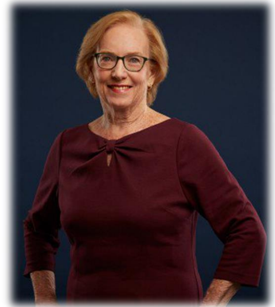
Dansk Sygeplejeråd Kreds Midtjylland