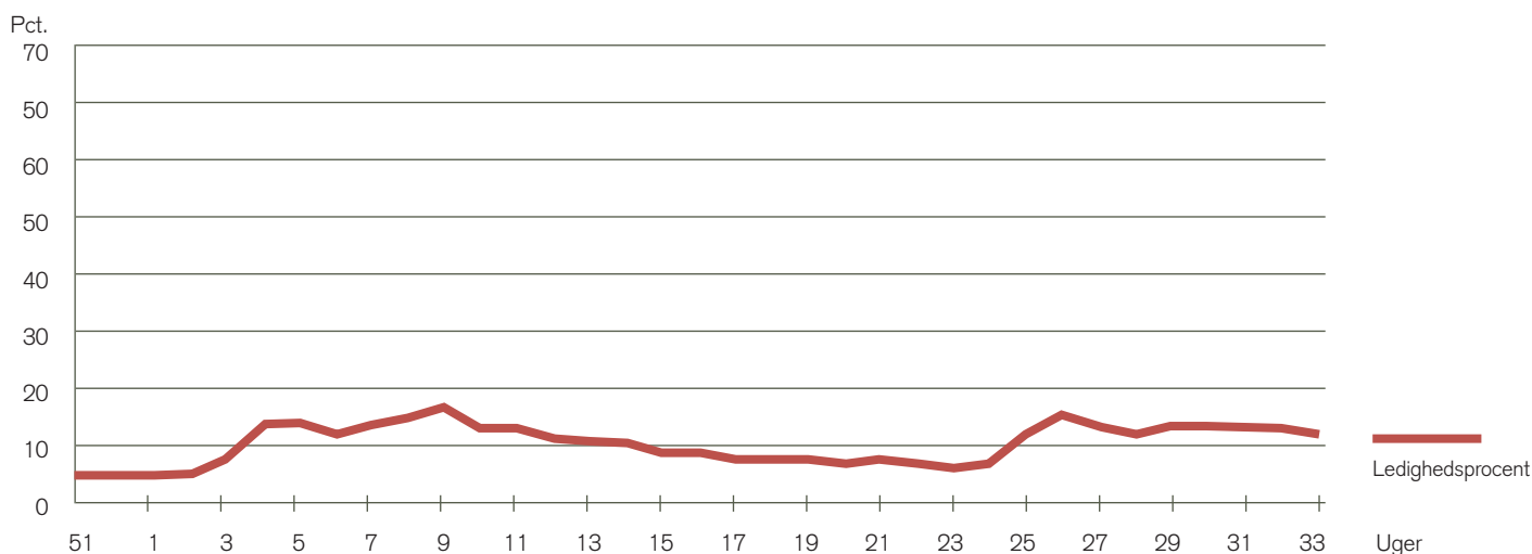
Figur 1: Dimittendledighed for en række sundhedsprofessionsgrupper i 2013