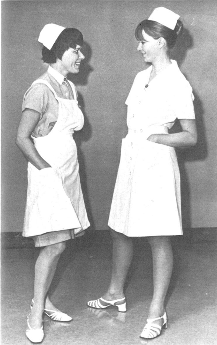
Til højre ses den nye uniform for sygeplejersker, sygeplejeelever og sygehjælpere. Afdelings- og oversygeplejerskeuniformerne har samme snit, men med \frac{3}{4} -ærmer.