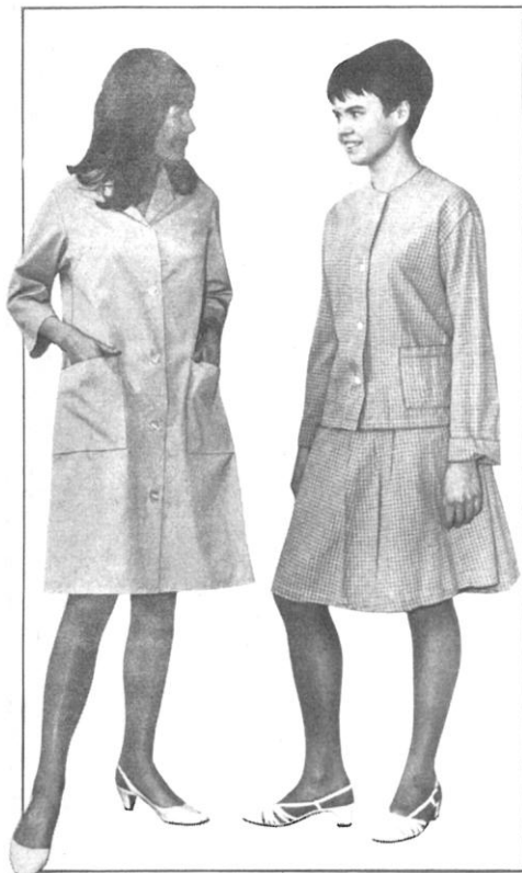
Påklædningen for de kvindelige patienter er der ikke ofret meget på. De skal gå i kittel

Portørerne kan glæde sig. Deres dragt er virkelig blevet mere praktisk og klædelig. I stedet for den gamle uniformsjakke med alle knapperne er der tiltænkt dem benklæder og busseronne med lange eller korte ærmer. Ingen knapper, der falder af.