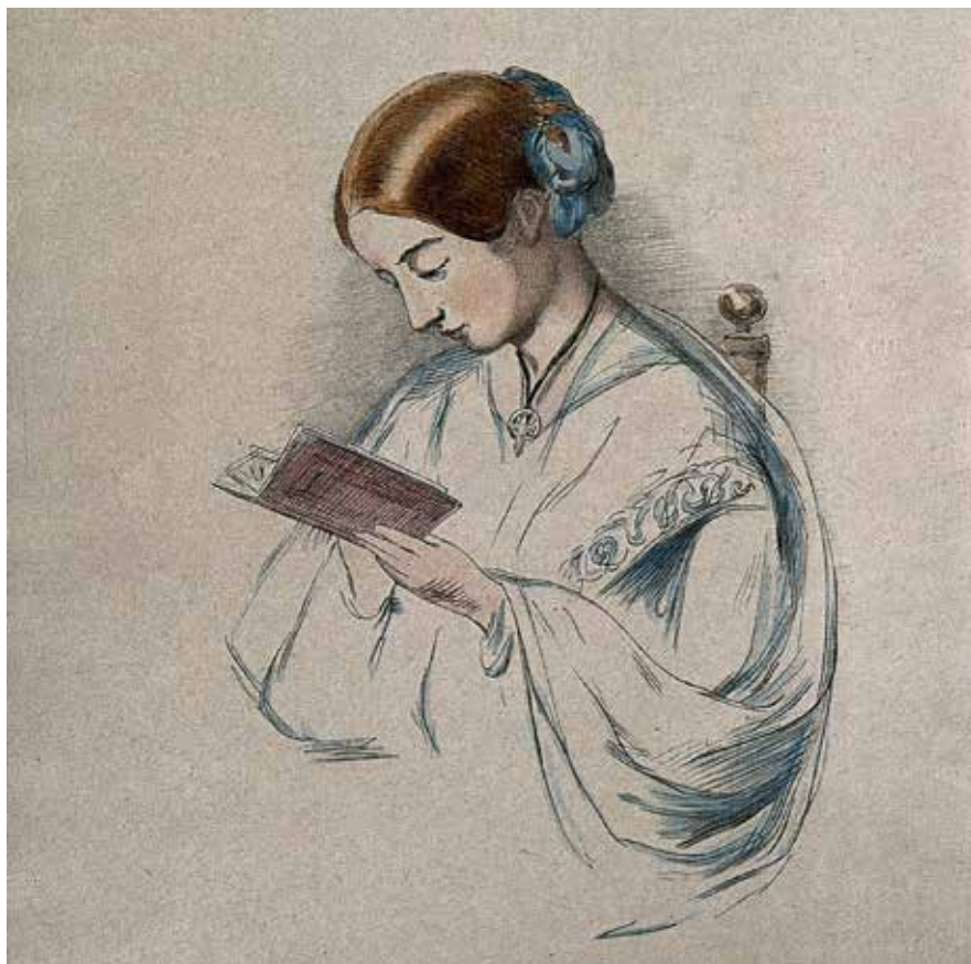
Den unge Florence Nightingale tegnet af hendes kusine Hilary Bonham-Carter.