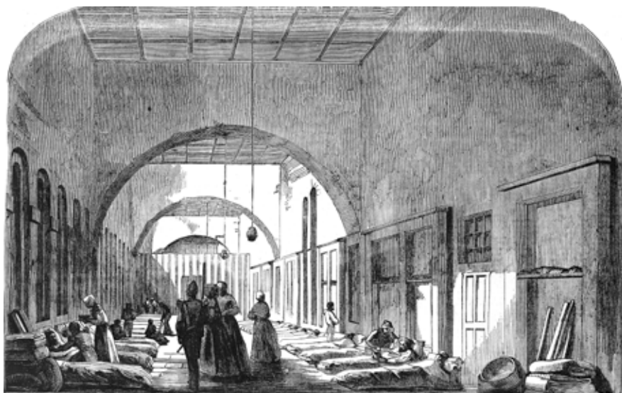
Florence Nightingale på inspektionsrunde gennem de kilometerlange hospitalsgange, hvor soldaterne lå på gulvet.

Florence var stædig, og hun fik efter megen overtalelse lov til at lære sygepleje hos de protestantiske diakonisser i Kaiserswerth i Tyskland og hos den katolske sygeplejeorden, De Barmhjertige Søstre i Paris. Bagefter arbejdede hun et år som forstanderinde på the Institution for Sick Gentlewomen in Distressed Circumstances - et hjem for dårligt stillede lærerinder og guvernanter, hvor hun viste sig som en særdeles dygtig leder og organisator. Hun forbedrede ikke bare sygeplejen, hun satte også en ny standard for hjemmets administration og effektivitet.