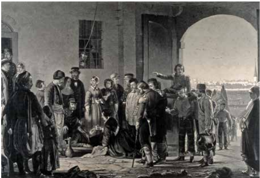
Florence Nightingale visiterer nytilkomne sårede soldater på hospitalet i Scutari

Florence Nightingale er mest kendt som den mytologiske sygeplejerske med lampen. Det er mindre kendt, at hun i virkeligheden ikke selv udførte megen sygepleje. Hendes tid var helt optaget af at få organiseret hospitalet, få styr på ventilation, kloakker, vaskeri og køkken. Hjemmefra havde hun lært at styre husholdningen på et stort gods, og det kom hende til god nytte.