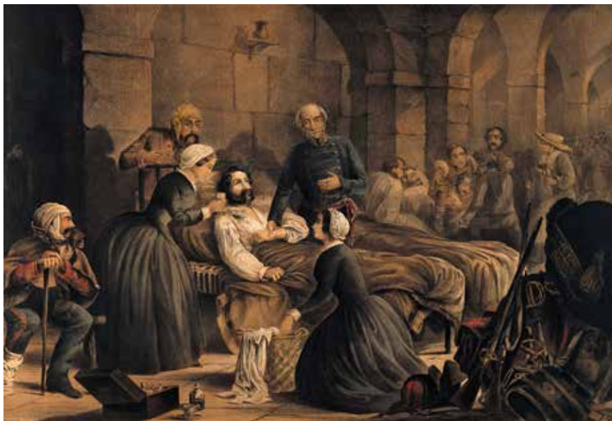
Et idealiseret billede af Florence Nightingale hos en patient på hospitalet i Scutari Wellcome Collection

Hver aften gik hun med sin lygte i hånden en runde gennem de kilometerlange hospitalsgange, og soldaterne tilbad hende og gav hende tilnavnet "The