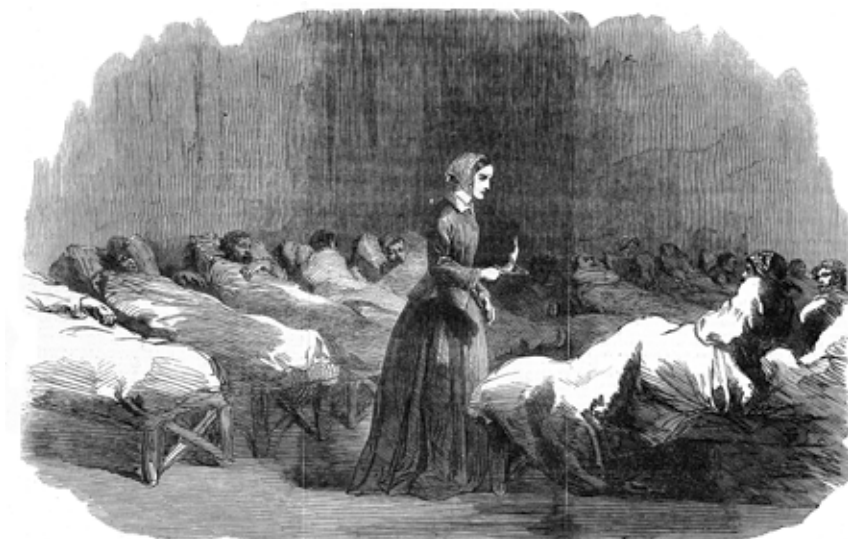
Florence Nightingale på sin daglige tilsynsrunde med den berømte lampe på det store militærhospital i Scutari under Krimkrigen 1854-56.

Her går vi bagom myten og ser på, hvad hun egentlig stod for, og hvad hun udrettede.