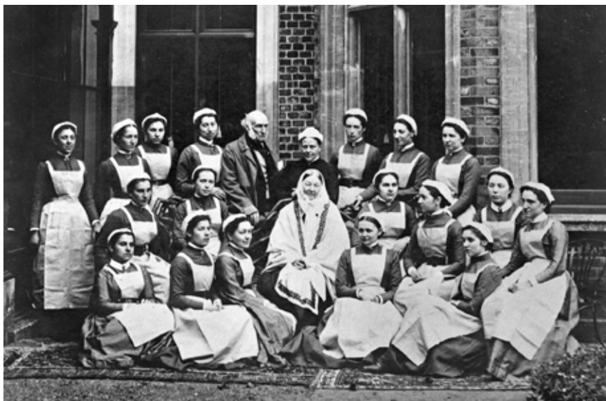
Florence Nightingale med sine elever på et af sine sjældne besøg på Nightingale Training School.

Nightingale's vigtigste rolle at optræde som politiker. Kvinder havde ikke valgret, men hun havde stærke politiske kontakter, som hun uden skrupler brugte til at fremme sager som hærens sundhed, sundt hospitalsbyggeri og folkesundhed i form af ren luft, rent vand og sunde boliger for alle.